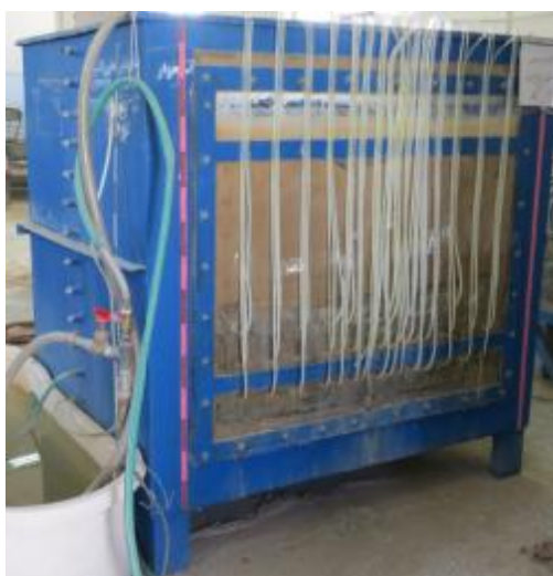
شکل (1): نمای خارجی مدل فیزیکی

برای ایجاد شرایط بحرانی و کاهش زمان آزمایش‌ها خاک مورد استفاده باید دارای نفوذپذیری نسبتاً بالایی باشد تا در زمان کمتری محیط اشباع شده و به تعادل برسد. همچنین بافت خاک مورد نظر باید به گونه‌ای انتخاب گردد که فرض نفوذپذیری یکسان در جهات مختلف برقرار باشد. به همین دلیل خاک مورد استفاده در مدل فیزیکی از نوع ماسه‌بادی ریز و تمیز در نظر گرفته شد و خصوصیات آن در جدول 1 ارائه گردیده است.